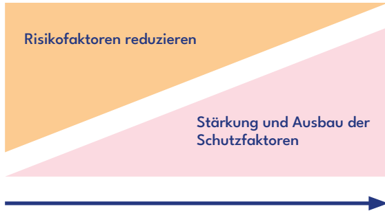
Abbildung 3 FÖRDERUNG DER RESILIENZ DURCH EINFLUSSNAHME AUF RISIKO- UND SCHUTZFAKTOREN