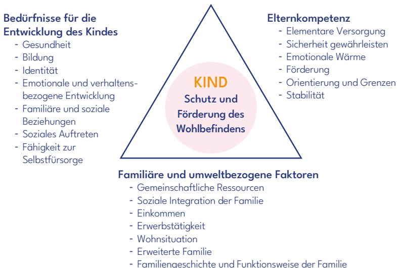
Abbildung 1 BEWERTUNGSSCHEMA

Anmerkung: Abbildung aus Ward et al., 2014, S. 25